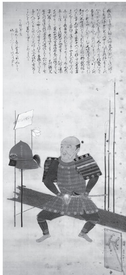
沢村大学肖像画(佐伎治神社蔵) 高浜町指定文化財