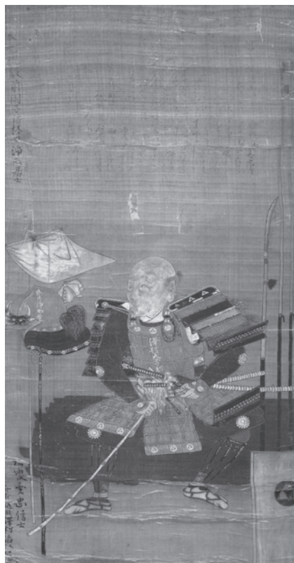
沢村吉重像(当館蔵) 福井県指定文化財