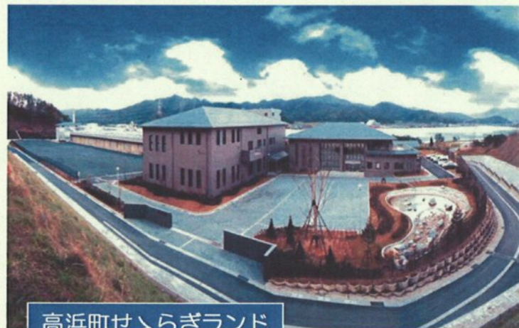
高浜町せらぎランド