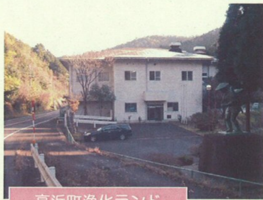
高浜町浄化ランド

現在、し尿・浄化槽汚泥は、平成4年度に供用を開始した「高浜町浄化ランド」において処理されていますが、近年、公共下水道・集落排水の