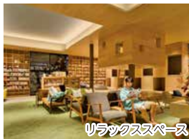
リラックススペース