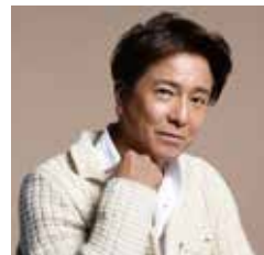
映画「ライフセーバー」出演 ゲストランナー 風間トオルさん