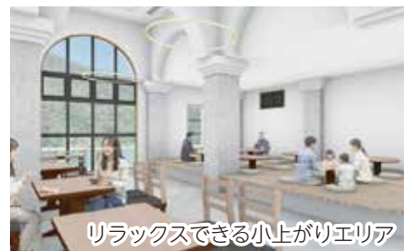
リラックスできる小上がリエリア

今後も新デザインの内容や工事の進捗状況など、本紙や町ホームページなどで随時お知らせします。