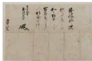
▲天正19年細川忠興知行宛行状