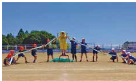
タオルを使って青葉山を表現