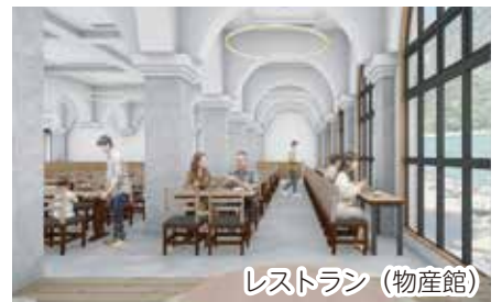
レストラン(物産館)