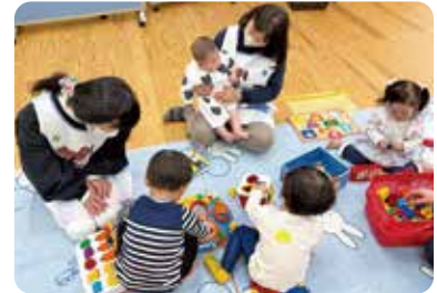
託児で健診をサポート