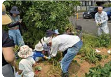
じゃがいもの収穫をお手伝い