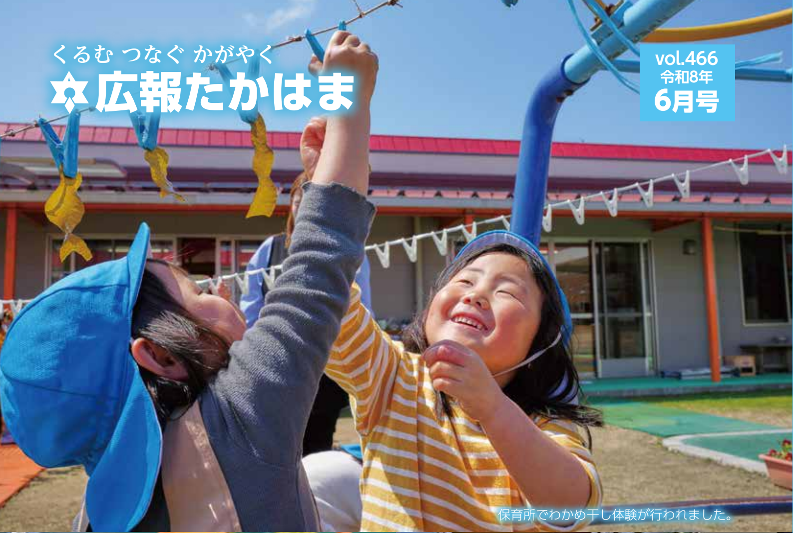
保育所でわかめ干し体験が行われました。