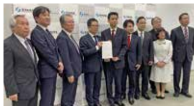
経済産業省 井野副大臣との面談