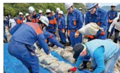
改良型積み土のう工法Ⅱ

本訓練では、洪水などによって水が堤防を越えるおそれがあるときに用いる「改良型積み土のう工法Ⅱ」の実践や、土砂災害発生を想定した「土砂災害救助訓練」や「徒手搬送訓練」を実施しました。また赤十字奉仕団による炊き出し訓練や給水車による給水訓練も行い、技術の習得、水防意識の高揚に努めました。