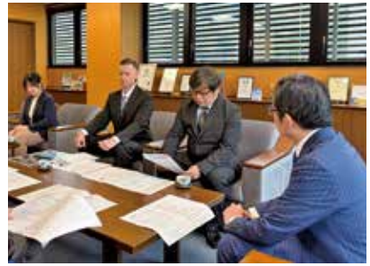
前年度の活動報告