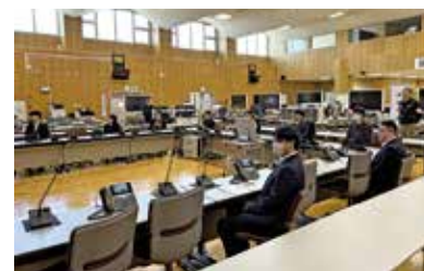
【原子力政策等に関する要望活動】