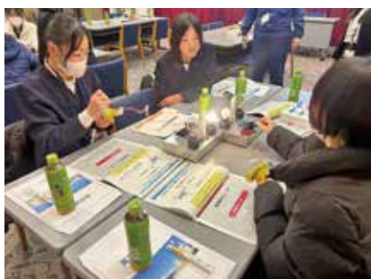
手回し発電実験(和田小学校)