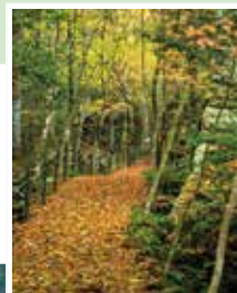
この道はおすすめ！