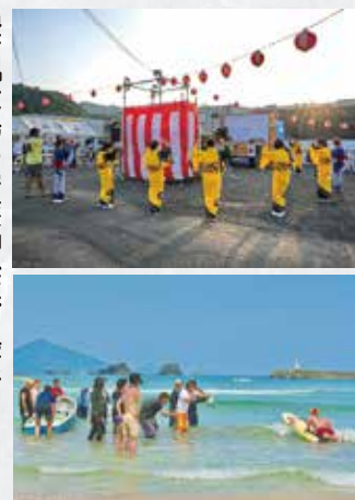
映画「太陽の守護神(仮)」撮影