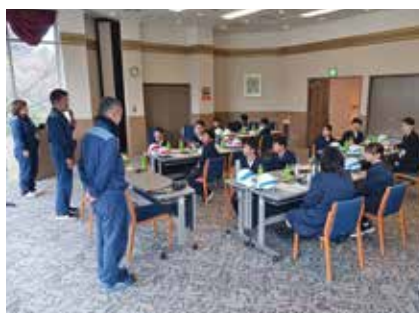
概要説明(青郷小学校)