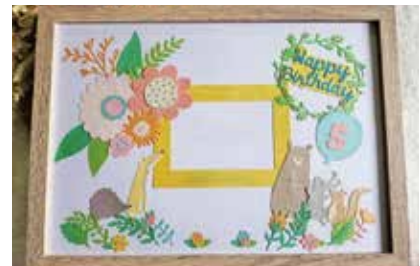
かわいいフォトフレームができました