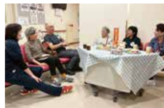
認知症に関する研修を受けたスタッフがお待ちしています