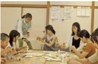
好きなパーツを選ぶのが楽しそうです

kurumuでの出会いを通して、お子さん同士、親御さん同士の輪が広がっていくことを願っています。