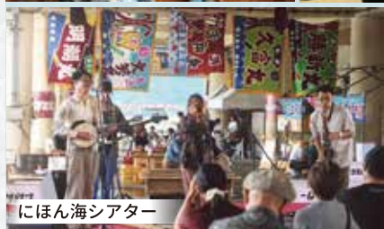
にほん海シアター