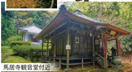
馬居寺観音堂付近

心が落ち着く場所へ 特に印象的なのが、山の中腹に建つ観音堂（町指定有形文化財）。北陸三十三カ所観音霊場第2番・若狭観音霊場第30番札所としても知られています。ここには、平安時代後期の木造馬頭観音坐像（国指定重要文化財）が安置されています。秘仏のため通常は拝観できませんが、午年に御開帳が行われており、今年は10月17日から18日の2日間公開され、18日に法要が行われます。道中は、沢のせせらぎや鳥の声、葉を揺らす風の音、森の香りが心地よく、歩くほど気持ちが落ち着いていきます。上の方ではイノシシが地面を掘った跡も見られ、里山の自然の豊かさを感じさせてくれます。日常を少し離れて静かな時間を過ごしたい方に、ぜひ訪れていただきたい場所です。