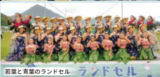
若葉と青葉のランドセル