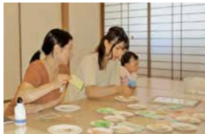
お話を楽しみながら作りました