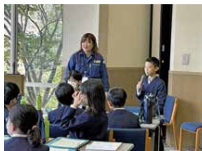
質疑応答(高浜小学校)