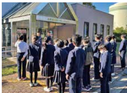
訪問時の様子(和田小学校)

構内見学では、電気をつくる「タービン建屋」と発電所を運転・管理する「中央制御室」を見学し、各種設備の大きさや施設内で行われている金属探知検査などの警備の厳重さを肌で感じながら、発電所職員の説明に耳を傾けていました。