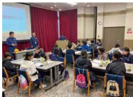
概要説明(青郷小学校)