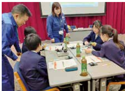
電気の実験(内浦小学校)