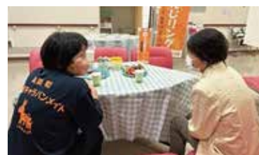
認知症に関する研修を受けたスタッフがお待ちしています