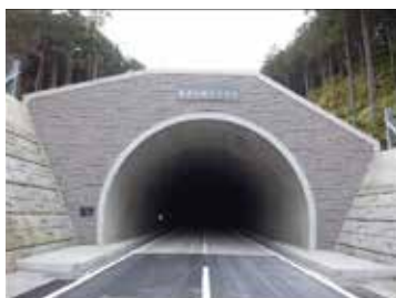
難波江坂トンネル坑口(難波江側)

現場には事前に予告看板を設置しますので、期間中の迂回について、ご理解とご協力をよろしくお願いします。