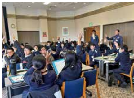
質疑応答(高浜小学校)