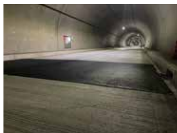
トンネル内部(隆起箇所)