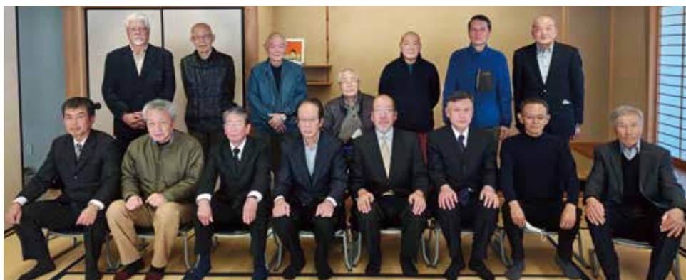
座談会に出席された佐伎治神社の赤坂宮司と新旧氏子総代・関係者の方々

本紙では、今後「高浜七年祭」に向けて、インタビューなども交え数回にわたり特集していく予定です。