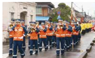
若狭消防組合音楽隊