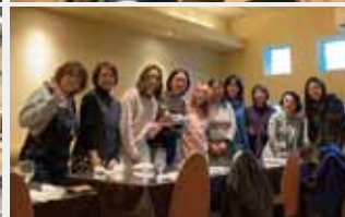
(上)協力隊の皆さんと青葉山登山 (下)女性隊員との交流会に参加

2年間ありがとうございました。移住して右も左もわからないなか、多くの方に支えられ2年間、務めることができました。卒業後も嶺南に住み、福井を拠点に仕事をしますので、どこかで見かけたら声をかけてください。今までありがとうございました!!