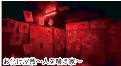
お化け屋敷〜人を喰う家〜