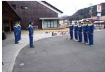
【職員派遣出発式の様子】

職員は、給水車による配水作業をはじめ、志賀町役場にて物資の仕分け作業等にあたりました。