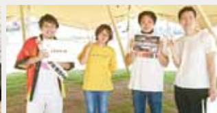
(上)テレビにも出演しPR活動 (下)小学校でクラブも担当