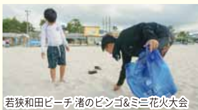
若狭和田ビーチ 渚のピンゴ&ミミ花火大会