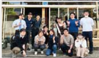
(上)観光PRの方法を学ぶ研修に参加 (下)県内の協力隊の皆さんとの交流