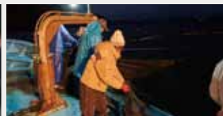
(上)初めての定置網取材 (下)特集記事の撮影