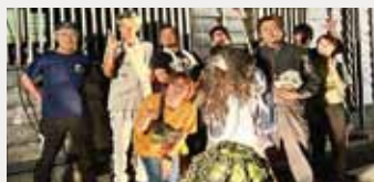
(上)イベント成功を祝う1枚 (下)講師として授業に参加

また、町内の小中学校とも積極的に交流をしてきました。高浜小学校では「探偵クラブ」の講師として2年にわたり、児童と謎解きを楽しむ時間を過ごしました。高浜中学校では、探究学習の授業でゲスト講師となり、高浜町のカレンダー制作のお手伝いをさせていただきました。様々な世代の方と交流でき、色々な刺激をもらうことができました。