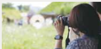
(上)撮影中の様子 (下)出張企画の取材中