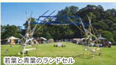
若葉と青葉のランドセル

画したりと、団体ごとの特色が出たものとなりました。多くの方が高浜町を知ることにつながり、町全体が活気にあふれたイベントとなりました。