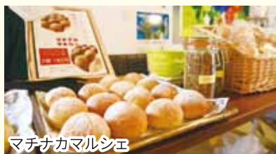
マチナカマルシェ