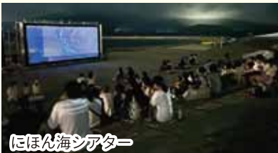
にほん海シアター