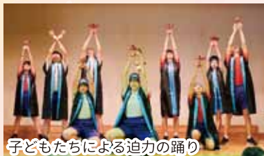
子どもたちによる迫力の踊り