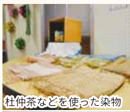
杜仲茶などを使った染物