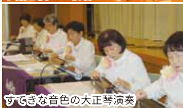
すてきな音色の大正琴演奏