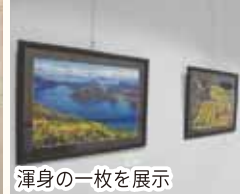
渾身の一枚を展示