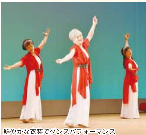
鮮やかな衣装でダンスパフォーマンス

今回は「心をつなぐ文化の絆」をテーマに開催され、2日間合わせて約820名の方が訪れました。4日(土)には水彩画や写真、生け花、伝統工芸の組子指物など15団体の作品が展示され、作品の前で足をとめる方が多く見られました。 5日(日)には、展示のほかに大ホールで舞台発表が行われました。高浜中学校吹奏楽部による演奏からスタートし、真美フレッシュ体操によるダンス、フラダンスとコラボレーションした高浜ウクレレ倶楽部によるウクレレ演奏、手話サークル「虹の会」による手話コーラスなど、11団体が演目を披露しました。また、文化功労賞とプログラム表紙図案入選者の表彰式も行われました。