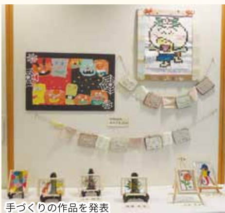
手づくりの作品を発表

期間中は、1階のエントランスに、NPO法人おひさまぷらすによる版画貼り絵や、廃材から抽出したオイルを使ってガラスに色をつけるディンプルアート、青郷公民館が発行している「広報紙ハウデイ」に今年度掲載された川柳、墨書会による書道作品など50点以上の作品が展示されました。 12日(日)には、2階の多目的ホールで舞台発表が行われ、RAINBOWそらとななによる手話パフォーマンスやべにかなめ会による大正琴演奏、青郷バンブー倶楽部による尺八演奏など9団体が、日々の練習や活動の成果を披露しました。舞台発表後にはお楽しみビンゴゲームが開催され、会場は盛り上がっていました。