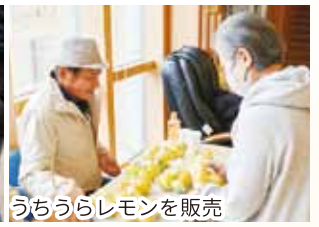
うちうらレモンを販売