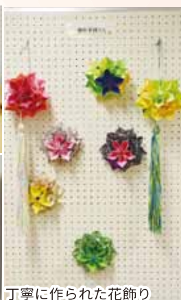
丁寧に作られた花飾り