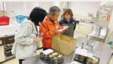
スタッフの方と配達先を確認