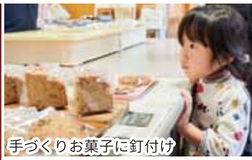
手づくりお菓자에釘付け