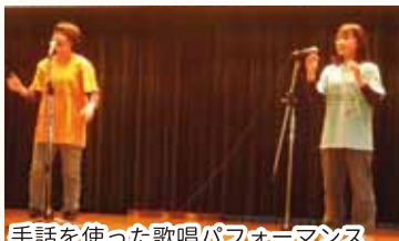
手話を使った歌唱パフォーマンス