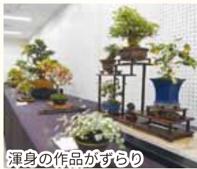
渾身の作品がずらり