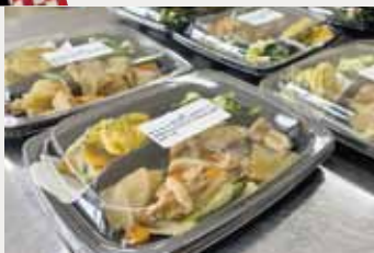
栄養バランスがとれたお弁当が完成