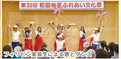
第32回 和田地区ふれあい文化祭 フィリピン実習生による歌とダンス