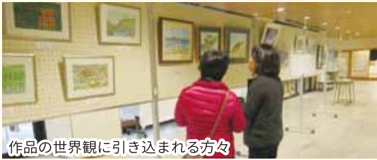
作品の世界観に引き込まれる方々