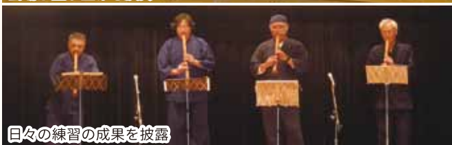
日々の練習の成果を披露