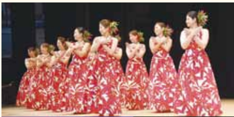
フラダンスとウクレレのコラボを披露