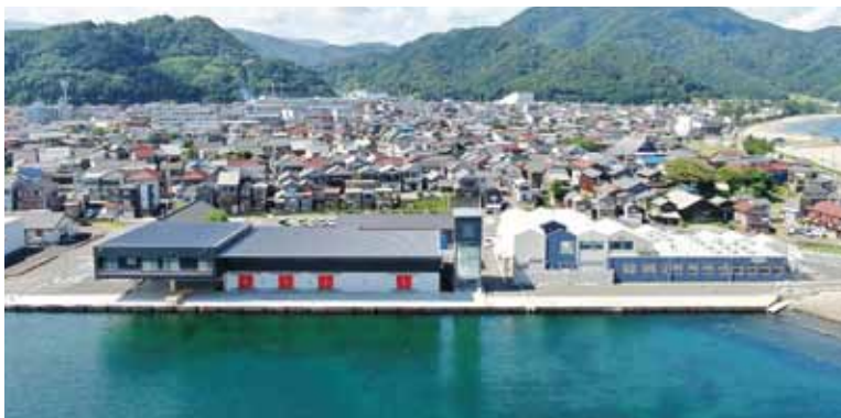
若狭高浜たらふく市場 【荷捌き施設・UMIKARA】

海の6次産業化の取り組みは、いよ いよこれからが本番となります。「漁 業関係者」や「UMIKARA」、「地域 商社まちから」、「行政」等 関係者が一 体となり、この新たな高浜漁港エリア から水産物の消費拡大や交流人口増加 の取り組みを推進し、持続可能な漁業 の実現に向け努力してまいります。