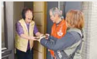
希望したご家庭にお弁当を配布