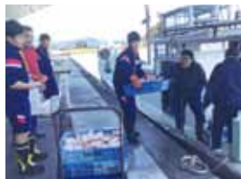
若狭高浜漁業協同組合