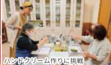
ハンドクリーム作りに挑戦