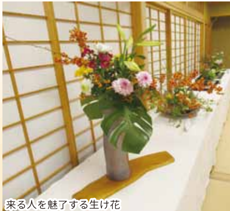
来る人を魅了する生け花

2日間にわたって開催された「和田地区ふれあい文化祭」には多くの方が訪れました。1階ホールには、和田小学校や和田保育所に通う子どもたちの作品のほか、陶芸作品や写真、書道、生け花、俳句など地域住民の方が心を込めて制作された作品がずらりと展示されました。今回は2億年前の化石「フズリナ」と「水石・姿石」が特別展示され、来る人の目を止めていました。 19日(日)には、2階大ホールで舞台発表が行われ、フィリピン実習生による歌とダンスやロケラニ・ホアモ工高浜によるフラダンス、童謡唱歌を歌う会による童謡歌唱などが行われ、笑顔に包まれて終了しました。