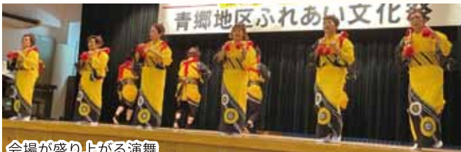
会場が盛り上がる演舞