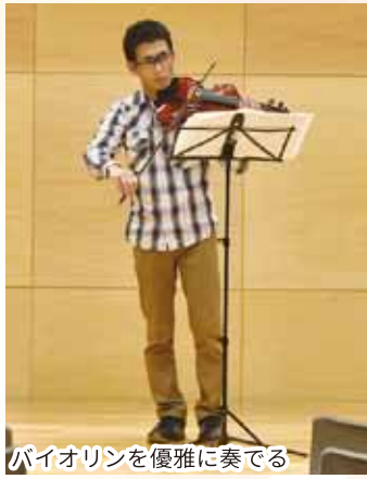
バイオリンを優雅に奏でる