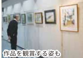
作品を観賞する姿も