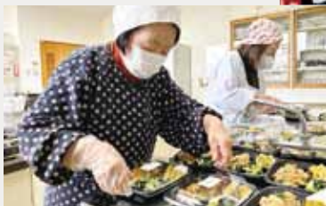
ボランティアの方々がお弁当作り