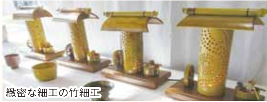
緻密な細工の竹細工