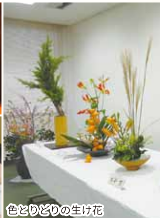
色とりどりの生け花