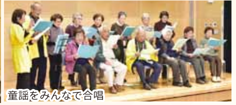
童謡をみんなで合唱