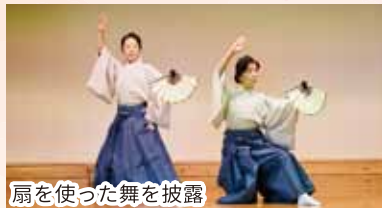
扇を使った舞を披露