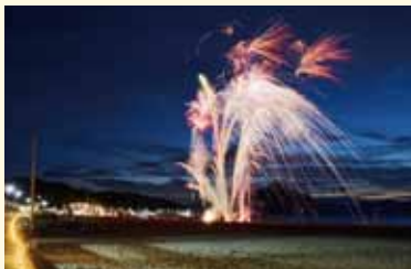
ミニ花火大会でフィナーレ