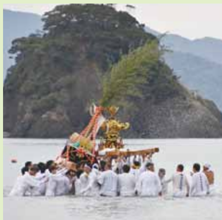
水しぶきをあげながらぶつかりあう神輿