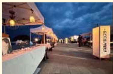
夕暮れ時のマーケットゾーン