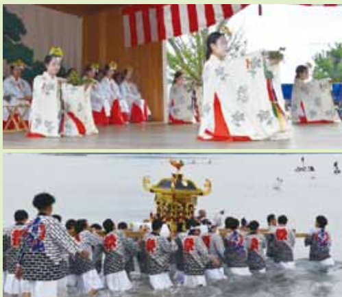
(上)浦安の舞を奉納(下)海に入っていく神輿