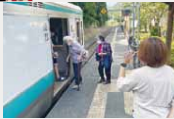
出発する電車のお見送り