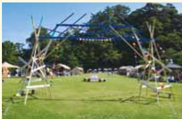
おしゃれでかわいい入場ゲート