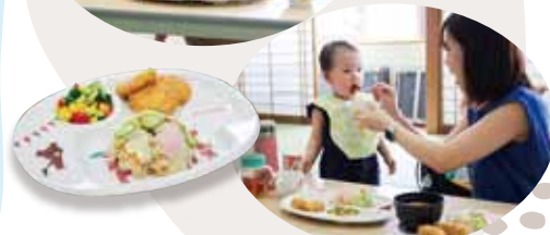
みんなで食べるとおいしいね