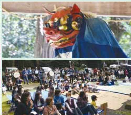
(上)青区氏子による神楽奉納 (下)神楽の奉納を観賞する皆さん