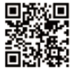
▲体験の様子はコチラ