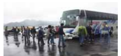
バスによる避難の様子

原子力災害時における広域避難のため、PAZ圏内(発電所より5km圏内)の住民、UPZ圏内(発電所より5~30km圏内)の住民それぞれがバス、自家用車、自衛隊などの実動機関で、県外避難先の兵庫県宝塚市、三田市、猪名川町に避難し、避難所運営訓練を実施しました。