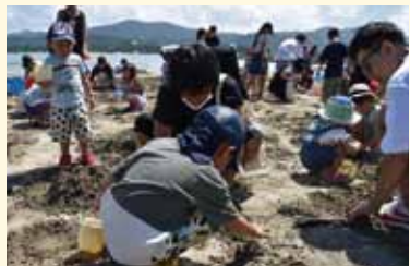
家族で参加する宝さがし