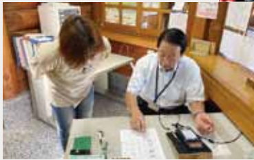
切符販売の手順をレクチャー