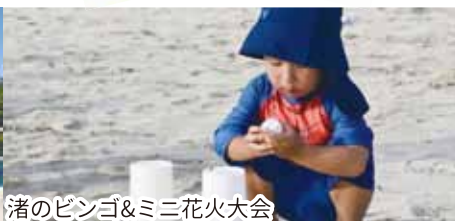
渚のピンゴ&ミニ花火大会