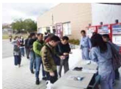
スマートフォンによる避難受付の様子

LINEで読み込む受付方法や、スマートフォンでの情報配信は今後、役立ったら良い。