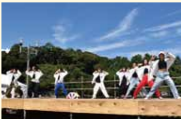
圧巻のステージパフォーマンス

育児や家事を頑張っている子育て世代が少しでもリラックスできる環境を作りたいという思いから「こどもが遊べる街」をコンセプトに、城山公園で「若葉と青葉のランドセル」が開催されました。町内外から1200人の方が訪れました。 このイベントは、専用通貨「R」を使って遊び、ゲームなどで獲得した通貨で買い物を楽しむというものです。当日は、ボールダーゲットの箱を狙う巨大パチンコや、車輪のついた台に乗りゴールを目指すストップオンザライドなどのゲームブースがずらりと並んでいました。ステージでは、ラムネの早飲み対決やダンス、ガラポン大会などが行われ、家族で楽しめるイベントとなりました。