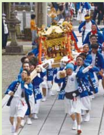
神輿を担ぎ、境内を走り抜ける

舞台では、11名の高浜中学校の生徒による「浦安の舞」の奉納や、「神楽」、「棒振り」に歓声や拍手が沸き起こっていました。祭りの最後には神輿の担ぎ手が肩まで海に浸かりながら沖まで入っていく「足洗いの儀」が行われると、会場は大いに盛り上がをみせていました。