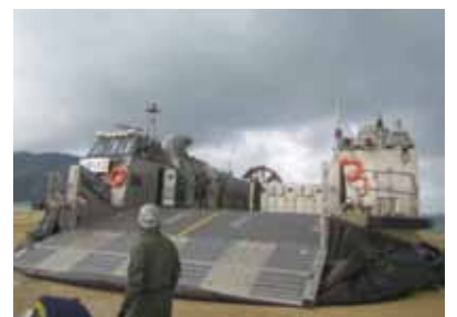
長井浜(おおい町)に上陸したエアクッション艇