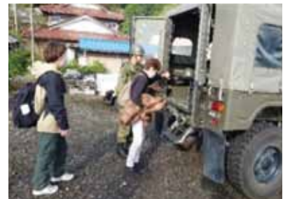
自衛隊車両による避難の様子

孤立集落からの避難としてヘリコプターを利用した訓練を実施。搬送訓練では海上自衛隊のエアクッション艇を使用しました。