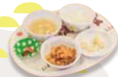
赤ちゃんも自然と口が動いたり、よだれが出たりと料理に興味を示します