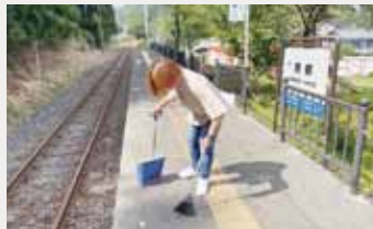
電車が来ない時間に清掃作業