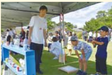
水鉄砲を手に狙いを定めて射撃