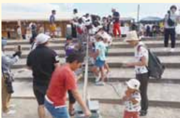
ワクワクする流しそうめん