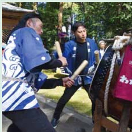
2人で1つの太鼓を激しく叩き合う