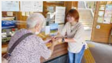
利用される方に切符を手渡し