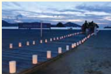
キャンドルライトを設置

ブルーフラッグ国際環境認証ビーチとして知られている若狭和田ビーチで、渚のビンゴ&ミニ花火大会が海水浴場開設期間の週末、3回にわたり、開催されました。3日間で7000人の方が参加されました。海の家で受付を済ませ、袋を片手にビーチクリーン活動を行い、参加者全員で、ビンゴ大会を開催しました。若狭牛や高浜町産コシヒ カリ、町内の特産品などが景品に並びました。ビンゴ大会終了後は、和田小学校「ゆめロード」プロジェクトで設置されたウッドロード(木の遊歩道)にLEDキャンドルを並べて、幻想的な空間を作り上げました。最後には、ミニ花火が行われました。参加者全員がゴミ問題について考え、遊んで楽しめるイベントとなりました。