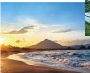
若狭和田ビーチと青葉山