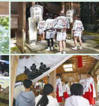
(上)氏子が神社に到着後、参拝 (下)青郷小・高浜中による浦安の舞