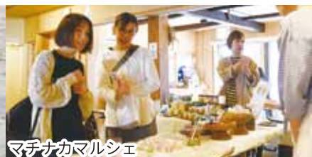
マチナカマルシェ