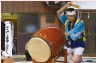
(上)会場の様子 (下)迫力ある太鼓(本町若連中)