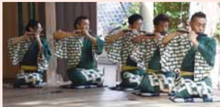
(上下)本町若連中によるお囃子の奉納