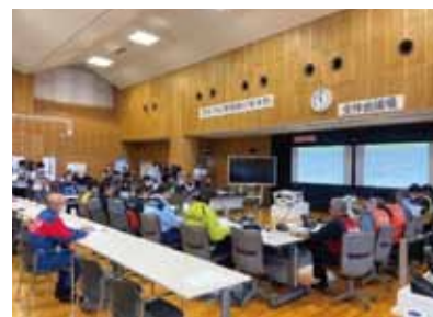
現地災害対策本部(オフサイトセンター)