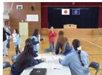
リスクコミュニケーションの様子