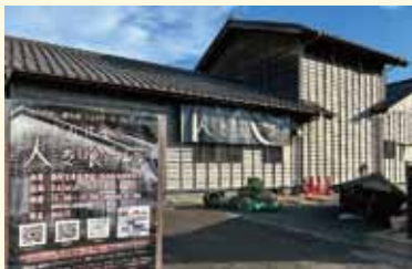
会場となった漁村文化伝承館