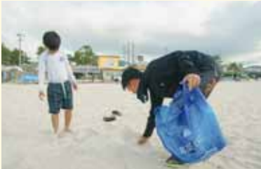
みんなでビーチクリーン