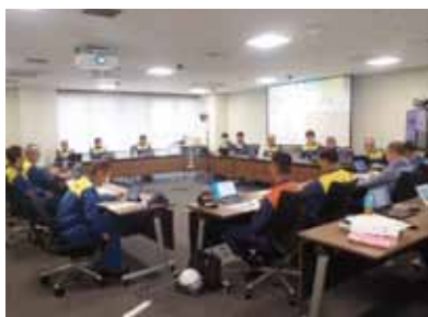
町災害対策本部(高浜町役場)

定期的な訓練を行うことで、防災意識の高揚と緊急時の対策を考えるきっかけになった。