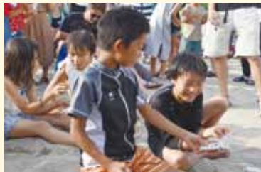
ドキドキのビンゴ大会を開催