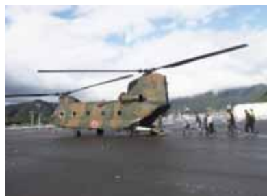
自衛隊ヘリコプターによる避難

定期的に避難訓練を実施することにより防災意識が高まる。いざというときどう行動をとるといいか避難場所・ルートが実際に確認できて良かった。