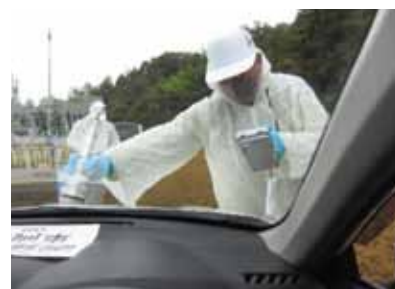
スクリーニング検査の様子