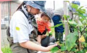
収穫ではひっぱたり、さわったり、野菜に興味津々