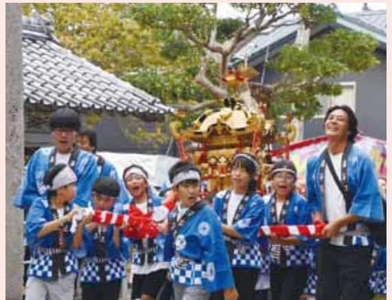
地区をねり歩いた子ども神輿が境内へ