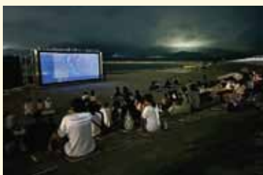
『リトルマーメイド』が上映

若狭富士が一望できる海岸沿いに、突如現れる海の映画館「にほん海シアター」が若宮海岸で開催され、子どもから大人まで約1500人が訪れました。 このイベントは、巨大スクリーンとマーケット、子どもの体験コンテンツが勢ぞろいし、家族連れなど、多くの方が楽しんでおられました。 今回は、音楽ステージと子ども向けブース、飲食・物販・喫茶エリアが並びました。また、「海と珈琲と映画」というコンセプトを掲げたこともあり、新たにコーヒー専用マーケットも設けられました。 午後6時15分からは2023年に公開されたデイズニー映画『リトルマーメイド』が上映されました。1日を通して楽しめるイベントとなりました。