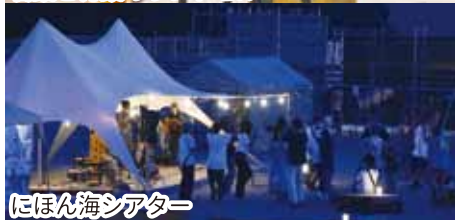
にほん海シアター