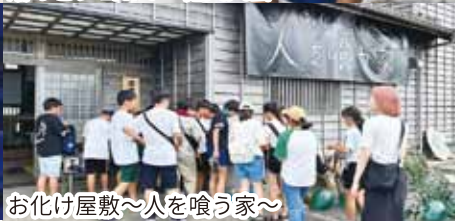
お化け屋敷~人を喰う家~