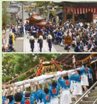
(上)会場の様子(下)社殿前で神輿を持ち上げる