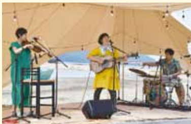
砂浜ステージでの音楽ライブ