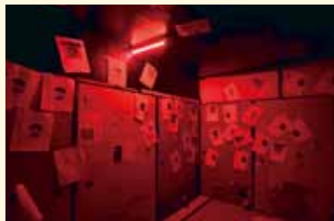
謎のチラシが一面に張り巡らされた部屋