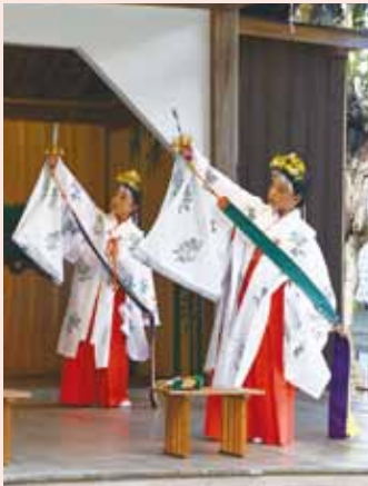
高浜小児童らによる舞の奉納

13日の本日は、神事から始まり、「浦 安の舞」が奉納され、午後からは、本町若 連中8名による「お囃子」が奉納されま した。両日とも参道の両側には露店が 並び、買い物を楽しむ姿も見られまし た。2日間にわたる例大祭は多くの方 が訪れ、幕を下ろしました。