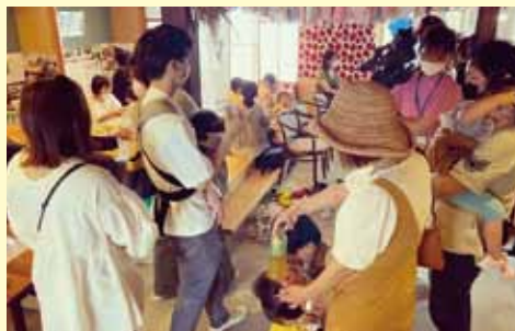
地域活性化交流事業