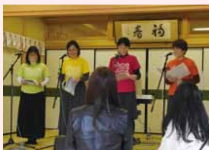
ピアノ・ピエーナによるコーラス