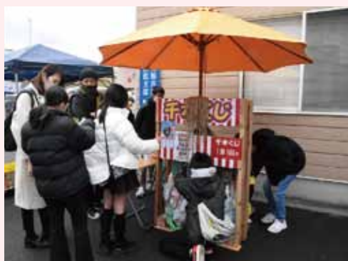
子どもたちに人気の「千本くじ」