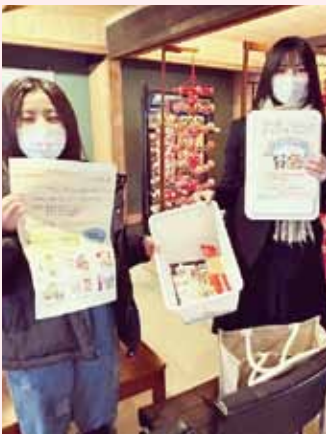
フードドライブを企画

また今年には、食品ロスの削減をテーマとする課題に取り組んでいる若狭高校の生徒2名が、家庭で余っている食品を集めて食品を必要としている福祉施設などの団体に寄付する「フードドライブ」を企画し、町内3か所に設置した回収ボックスにはたくさんの食品が集まりました。