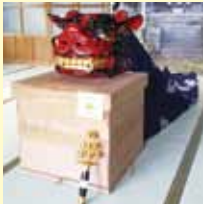
獅子頭等神楽修繕