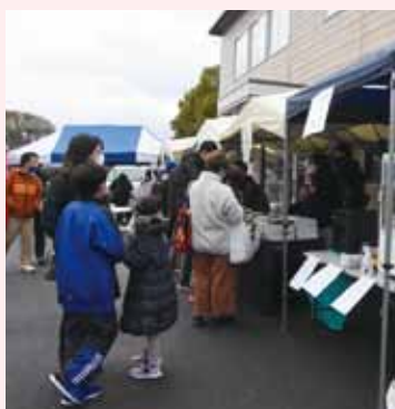
箱庭市も大にぎわい