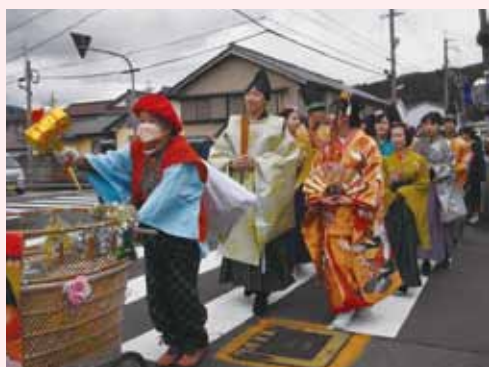
総勢20名で3年ぶりのひな行列

箱庭市には、弁当やスイーツ、フリーマーケットなどのお店が並び、子どもコーナーでは、クロスワードパズルや千本くじを楽しむ親子連れの姿もみられました。この日も、高浜小学校の児童5名と高浜中学校の生徒19名に、イベントのお手伝いをしていただきました。今年も、新型コロナウイルスのため中止していたひなまつり行列も開催することができ、多くの方に来ていただきました。来年、記念の20回目を迎える若狭たかまひなまつりにご期待ください。