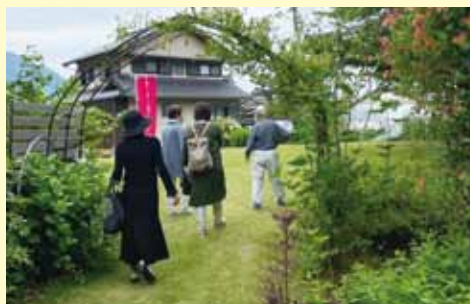
オープンガーデン in たかはま事業