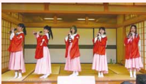
福井伝統工芸アイドルグループ「さくらいと」のライブパフォーマンス