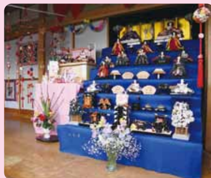
赤尾さん宅(立石区)