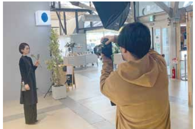
被写体の魅力を最大限に引き出した1枚を撮影