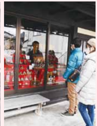
ひな人形をじっくりと観賞