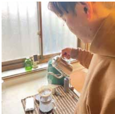
趣味はコーヒーを豆から挽いて飲むこと