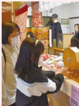
当たるかドキドキの抽選