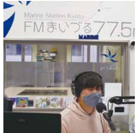
舞鶴市の方に高浜の魅力を発信