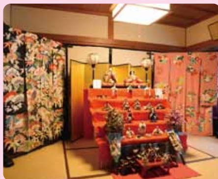
池田さん宅(若宮区)