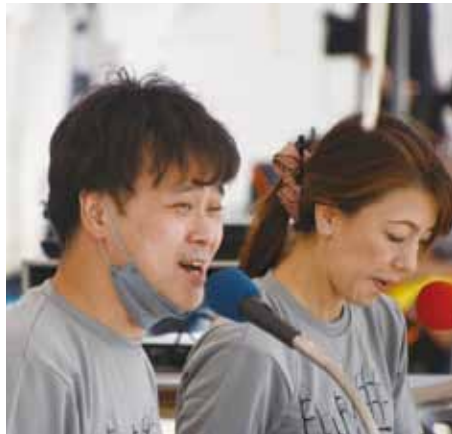
イベントのMCにも大抜擢