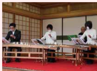
竹園会によるお琴の演奏