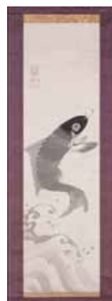
伊藤若冲作・昇鯉図 (大光明寺蔵)