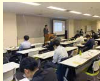
令和3年12月1日 ビジョンセンター浜松町にて(東京)

研修では、福島第一原子力発電所の廃炉を安全に進めるためのALPS処理水の処分についての現状の取り組みと復興に向けた対策等について専門家による解説がありました。福島復興には、放射性物質や廃炉作業について一人ひとりが正しく理解し、行動することが大切となるため、町では今後も関係機関と連携しながら積極的な情報発信に取り組んでいきます。