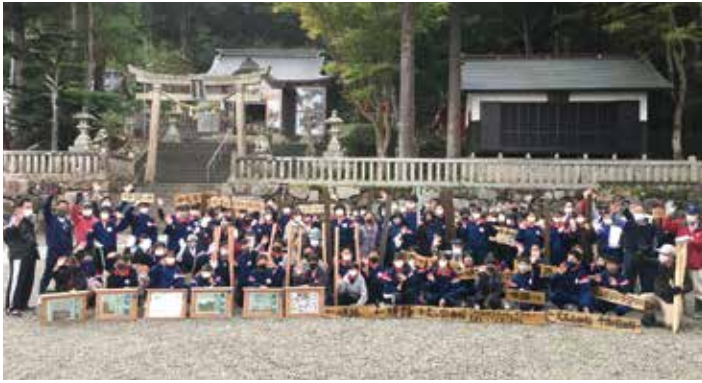
高浜中学校1年生と協力してくれた地域の人たち

砕導山城跡とは、佐伎治神社の背後の山全体に遺構が広がり「砕導山城砦群」と呼ばれるほどの大きな山城跡です。城の規模は若狭国最大で、基本的に「曲輪」、「切岸」、「堀切」を多く用いています。