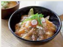
若狭マハタの漬け丼

UMIKARA食堂で販売されている人気メニュー「若狭マハタの漬け丼」が「越前若狭紅白自慢」(福井新聞社後援)の「福いいネー」(FO・O)のグランプリに出品し、福井県内6市町、7つの漁港の中から見事グランプリを受賞しました。審査員からは、「マハタといえば、刺身や煮物、しゃぶしゃぶを連想させるが、「漬け」という新しいマハタの食べ方を提案してくれた。」と高評を受けました。ぜひ一度食べてみてください。