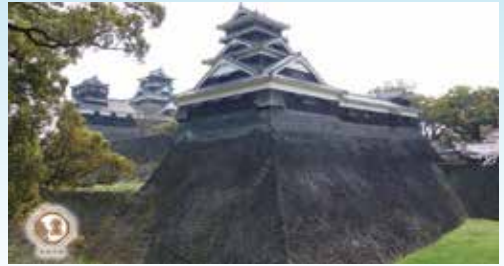
特別史跡 熊本城(熊本県熊本市)