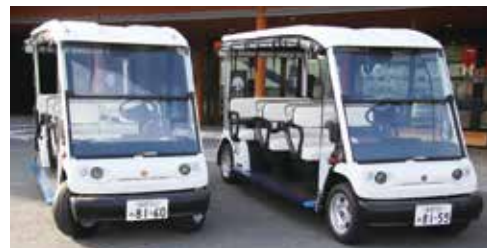
令和3年6月から町内市街地で実証実験をおこなったグリーンスローモビリティ（通称：グリスロ）