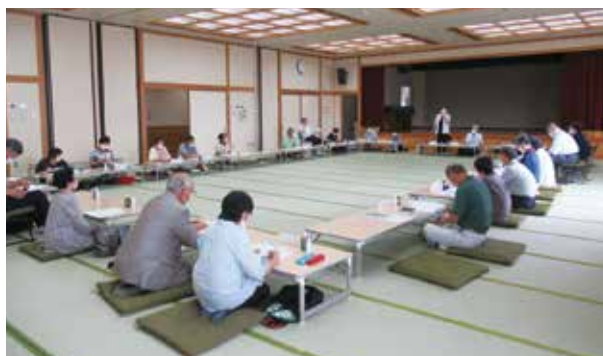
高浜町民生委員児童委員協議会 定例会の様子

目指しておりますが、私たち、 民生委員・児童委員にできるこ とにはどうしても限界がありま す。その点には、これからの地 域の皆さまや各関係団体の皆 さまとともに力を合わせて地域 福祉の向上に努めていきたいと 思っております。