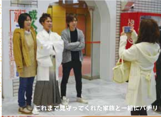
これまで見守ってくれた家族と一緒にパチリ