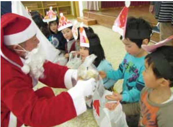
サンタからプレゼントを受け取る園児たち(高浜保育所)