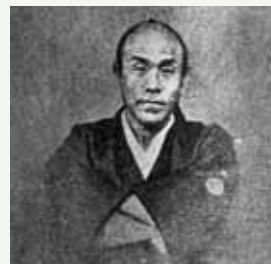
由利公正(三岡八郎)

◇連絡先／高浜町史編さん室 ☎(64)5710 (FAX 共通) (〒919-2225 高浜町宮崎90-5-1 高浜町教職員住宅101号室)