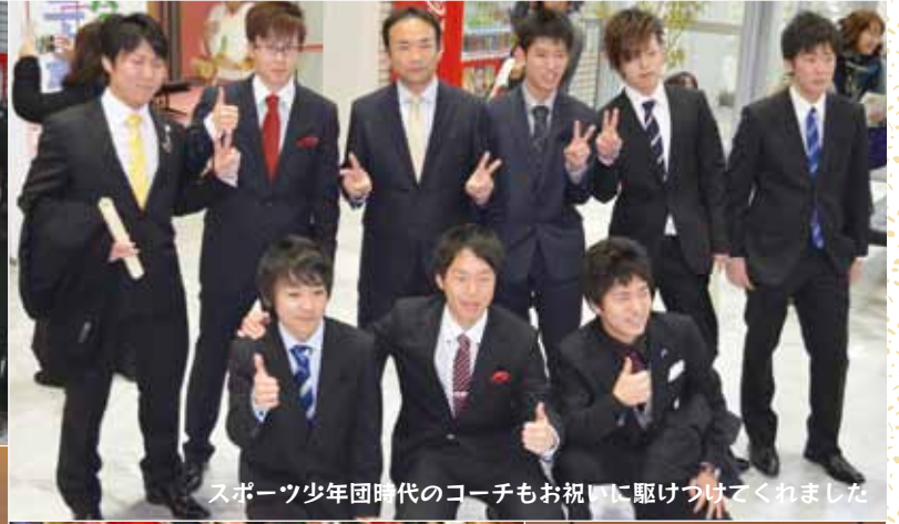
スポーツ少年団時代のコーチもお祝いに駆けつけてくれました