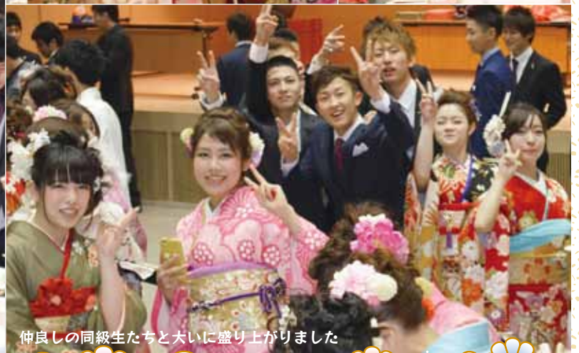
仲良しの同級生たちと大いに盛り上がりました