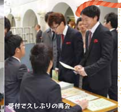
受付で久しぶりの再会