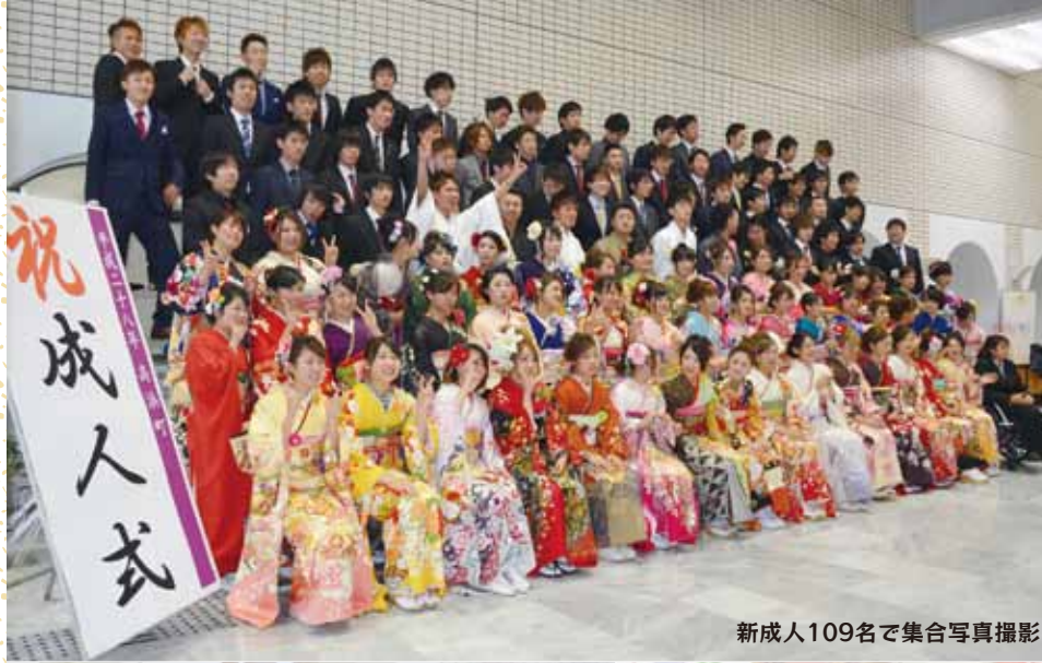
新成人109名で集合写真撮影