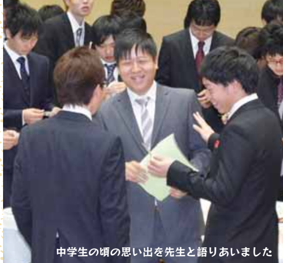
中学生の頃の思い出を先生と語りあいました