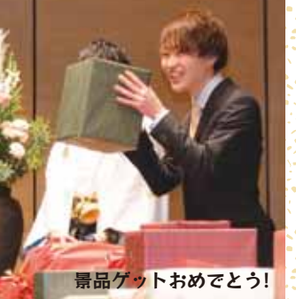
景品ゲットおめでとう!