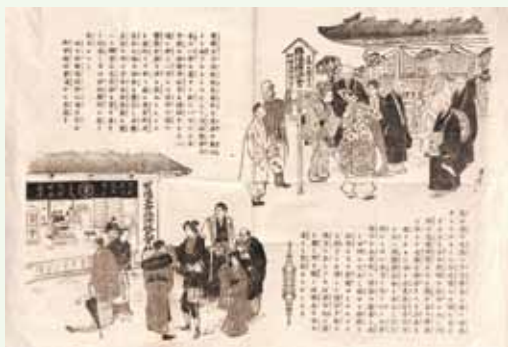
有隣生命保険株式会社の広告チラシ

今回寄贈された資料は、由利公正が設立した日本の生命保険のさきがけとなる「有隣生命保険株式会社」(本社：京都)の代理店契約書や保険事務関係の書類で、保険の種類は終身・定期・養老年金・修学資金・結婚資金があり、東京・大阪以外に、初代社長である由利公正の出身地、福井に店舗を構えました。県内の保険代理店は11店を数え、嶺南地方には敦賀・小浜・本郷・高浜の4店があり、今回寄贈していただいた旧家は有隣生命保険株式会社の設立当初から代理店契約を結んでおられました。