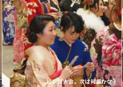
ビンゴ大会。次は何番かな?