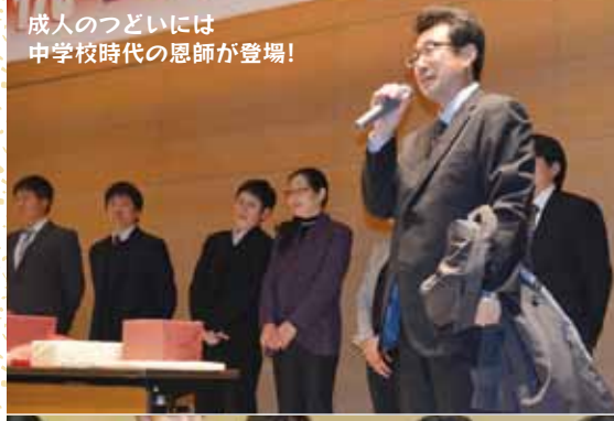
成人のつどいには 中学校時代の恩師が登場!