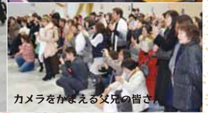
カメラをかまえる父兄の皆さん