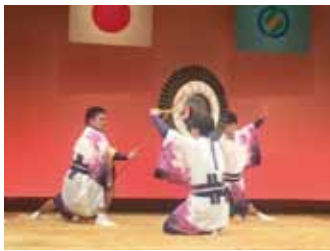
東部若連中の太刀振

姉妹都市である石川県志賀町との交流事業が行われました。25年目を迎える今年は、志賀町が合併10周年を迎える年で、その記念式典のステージにおいて高浜町の七年祭伝統芸能(東部若連中 太刀振りと大太鼓)を披露しました。