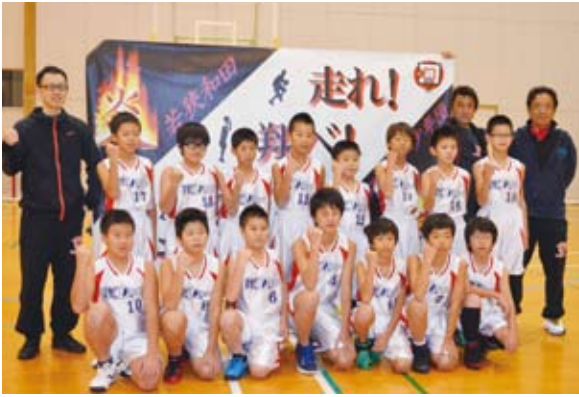
◇問い合わせ / 高浜町教育委員会 ☎(72)7725