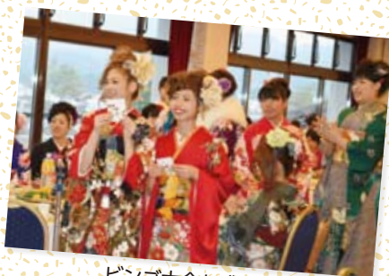
ビンゴ大会も盛り上がりしました