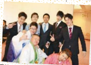
恩師の先生と感動の再会もありました 部活の顧問の先生と元部員たちが集結!