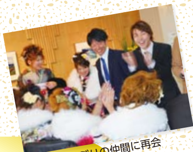
受付で久しぶりの仲間に再会