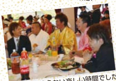
笑顔の絶えない楽しい時間でした