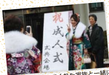
ここまで見守ってくれた家族と一緒に記念撮影

1月11日（日）、平成27年高浜町成人式が城山荘にて行われ、新成人が新たな第一歩を踏み出しました。 新成人175名、式典出席者139名（男66名、女73名）