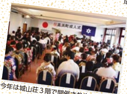
今年は城山荘3階で開催されました