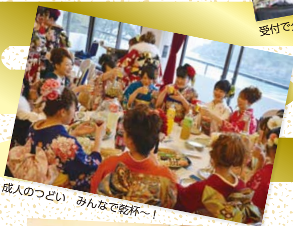
成人のつどい みんなで乾杯～!