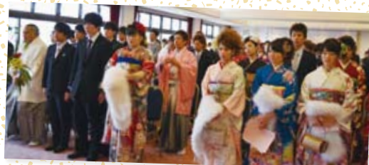
背筋をのばして、大人への第一歩です