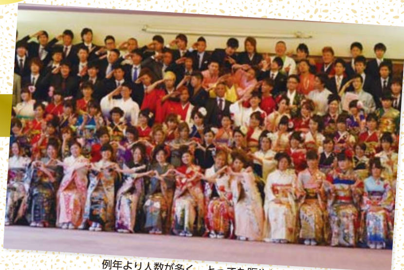
例年より人数が多く、とっても賑やかな集合写真となりました