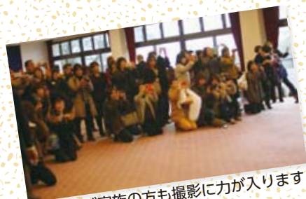
ご家族の方も撮影に力が入ります!