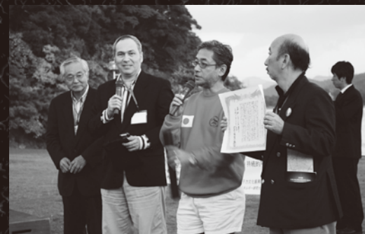
ランナーからランナーへ、高浜まで運ばれたメッセージ