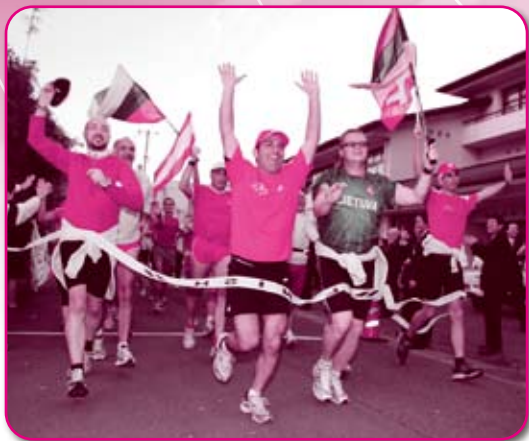
歓声をあげて、華々しくゴール!!

世界から集まった原子力産業の従事者が参加する「第13回マキシマソン」(NGO世界原子力従事者評議会、NPO法人持続的平和研究所主催)が開催されました。参加者のランナーは、11月4日、京都市をスタートし、「西の鯖街道」を駆け抜け高浜町にゴールしました。研究者や科学者、従業員、立地地域住民など原子力発電にかかわる多くの人々が、本町を舞台に言葉や文化の壁を超えて交流。イベントをとおして、地球に優しい・原子力の平和利用と核の廃絶をアピールしました。 このイベントは1996年、パリブリュッセルではじまりました。毎年各国で開催しており、日本での開催は初めて。フランス、スイス、スペイン、ロシアなど8カ国から約90人が参加しました。