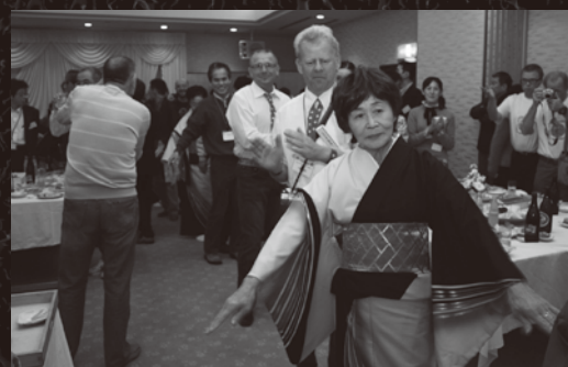
城山荘でのレセプションの一幕 各国入り乱れて「炭坑節」