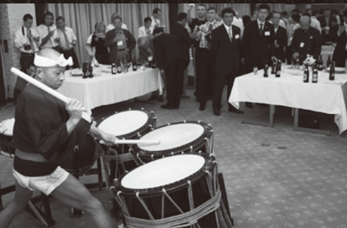
迫力ある太鼓演奏にくぎづけ

ランナーは4日早朝、京都市の四条大宮駅前を出発し、途中でバスを利用しながら本町へ。ゴールの城山公園を目指し、沿道の町民の声援と拍手に背中を押されて最後の力を振り絞って激走。高浜中ブラスバンド部の演奏に迎えられて無事にゴールし、歓声を上げました。 ゴール後、ランナーから、高浜の子どもたちに向けて「高浜は昔、都に貴重な海産物を届け、いまや京都や大阪の大都市に原子力の電気、そして文化を届けている。そのことに誇りを持って」とのメッセージが伝達されました。 また翌5日は、町内の小中学生と交流したほか、「ドコイコ！ ナニシヨ！ ミニツアー2008」のメニューを体験。座禅や茶道など、高浜の文化や歴史をゆつたりと満喫していました。