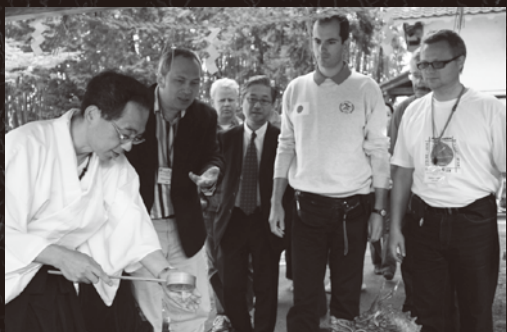
青海神社ではお清めの作法を学ぶ