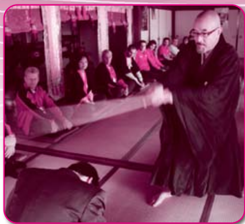
大成寺で「ZEN（座禅）」体験

ランナーは4日早朝、京都市の四条大宮駅前を出発し、途中でバスを利用しながら本町へ。ゴールの城山公園を目指し、沿道の町民の声援と拍手に背中を押されて最後の力を振り絞って激走。高浜中ブラスバンド部の演奏に迎えられて無事にゴールし、歓声を上げました。 ゴール後、ランナーから、高浜の子どもたちに向けて「高浜は昔、都に貴重な海産物を届け、いまや京都や大阪の大都市に原子力の電気、そして文化を届けている。そのことに誇りを持って」とのメッセージが伝達されました。 また翌5日は、町内の小中学生と交流したほか、「ドコイコ！ ナニシヨ！ ミニツアー2008」のメニューを体験。座禅や茶道など、高浜の文化や歴史をゆつたりと満喫していました。