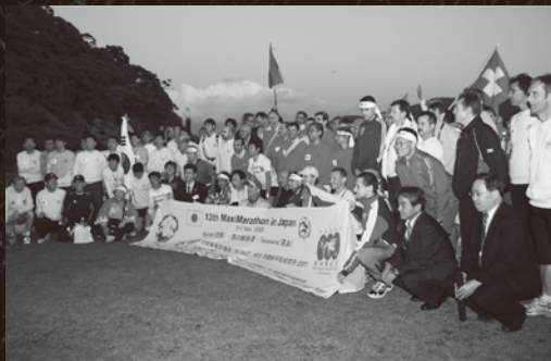
無事ゴールを祝し、城山公園で記念撮影