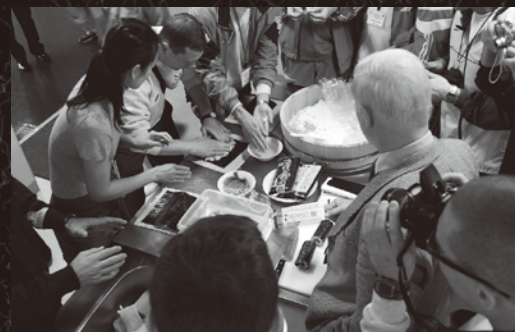
ミニツアーで高浜を満喫 「たかはま鮎」の作り方に興味津々