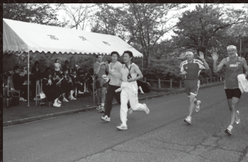
ゴールまであと少し。高浜中のブラスバンド部の演奏がお出迎え