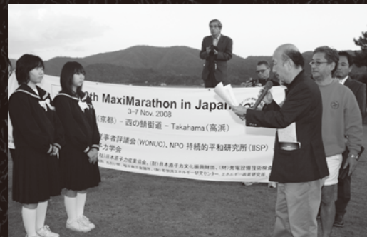
高浜町の子どもたちに向けてメッセージを伝達