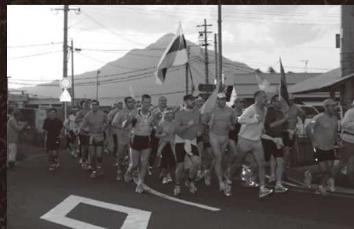
町民の声援に支えられ激走