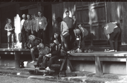
中山寺で日ごろの疲れをゆっくり癒す