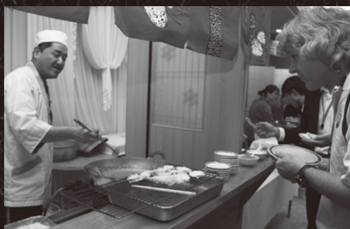
目の前で「テンブラ」を揚げる屋台が大人気