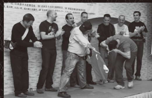
ステージではスペインチームが「闘牛」を披露