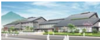
町新庁舎・新公民館 / 完成予想図 (平成28年春完成予定)

海沿いに発展してきた高浜の町。現在は国道沿いに街区形成が着実に進んでいます。町役場庁舎・公民館の新築移転や文化会館などの主要公共施設が集まる内陸から山の手にも、多くの住宅地開発が進みます。