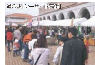
道の駅「シーサイド高浜」

遊・職・住と三拍子揃った高浜。町内通勤はもとより、駅まで2分、舞鶴市街まで約20分の距離。舞鶴若狭自動車道「大飯高浜IC」から7分と、他府県からのアクセスも充実。