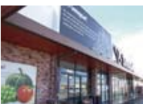
スーパーマーケット(1.7km)