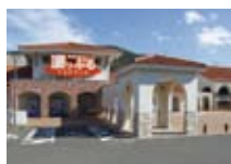
道の駅「シーサイド高浜」(5.3km)