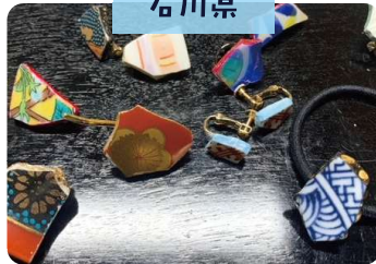
九谷焼の破片を使った アクセサリー作り