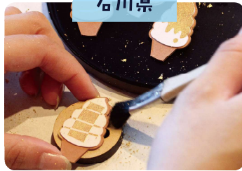
パッチの金箔貼り体験