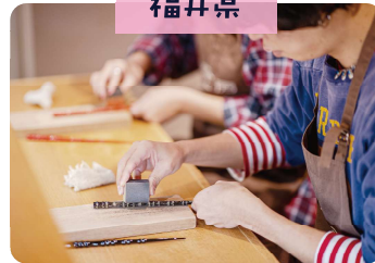
若狭塗り 箸の研ぎ出し体験