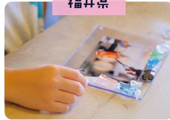
色とりどりのガラスを使った モザイクフォトフレーム作り