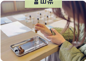
富山の森の香で ロールオンアロマ作り