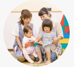
保育資格のあるスタッフが お子様をお預かりします！