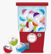
3ブース以上回られた皆さまに ちょっと良いものが当たる！ ガチャガチャチャンス！