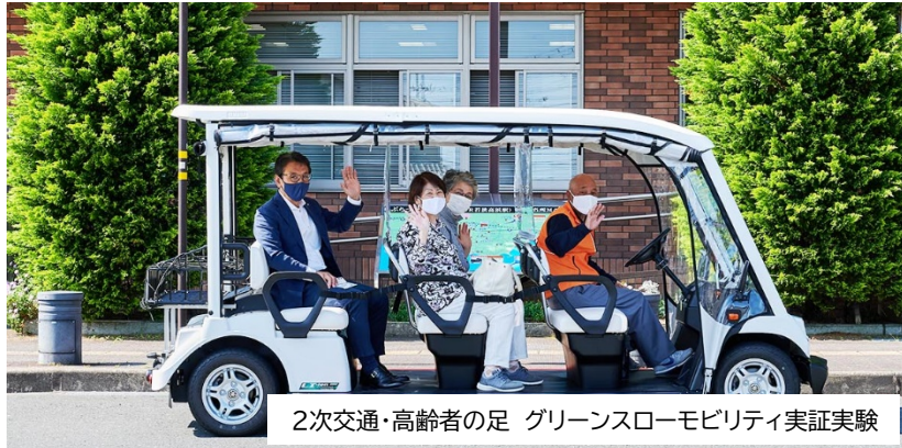
2次交通・高齢者の足 グリーンスローモビリティ実証実験