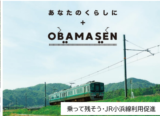
あなたの暮らしに + OBAMA SEN