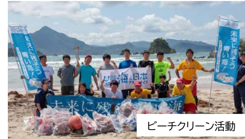
ビーチクリーン活動