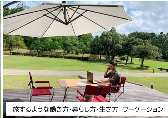
旅するような働き方・暮らし方・生き方 ワーケーション