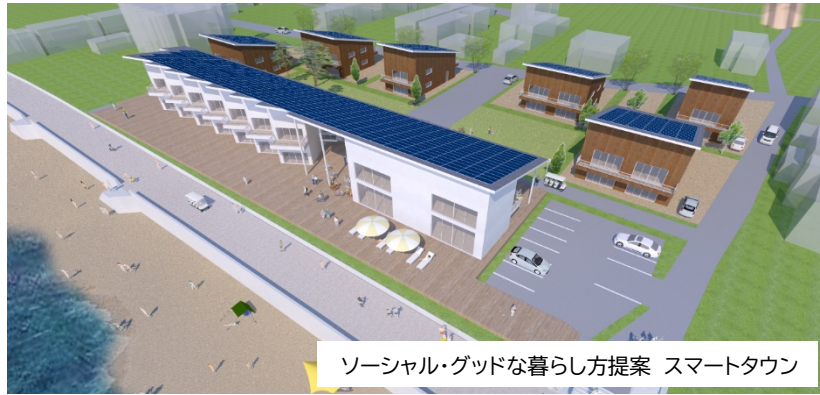
ソーシャル・グッドな暮らし方提案 スマートタウン

2016年、アジアで初めてビーチの国際環境認証ブルーフラッグを取得し、持続可能なまちづくりがスタートしました。現在、スマートタウンの創出、グリーンスローモビリティ(二次交通)実証実験、JR小浜線(ローカル線)を残す運動、おいしい循環(薬草の産地化、魚食・海の6次産業化など)、ワーケーションやサテライトオフィス誘致、そして地域・社会課題を解決するソーシャル・グッド人材およびウェルビーイング人材の育成など、地域を元気にする共創事業「ソーシャル・グッド・プロジェクト(SDGs)」にチャレンジしています。ぜひ、皆様のご支援をお願いいたします。