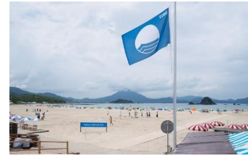
ビーチの国際環境認証 ブルーフラッグsince2016