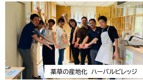
薬草の産地化 ハーバルビレッジ