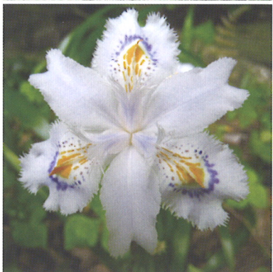
青葉山麓の自生植物