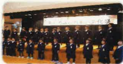
青郷小学校4・5年生 (合唱・合奏)