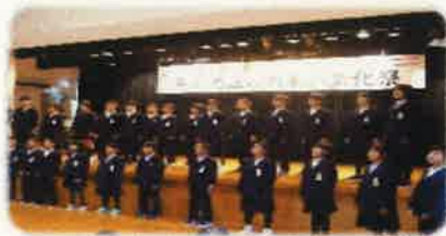
青郷小学校4・5年生 (合唱・合奏)