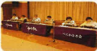
べにかなめ会 (大正琴演奏)