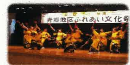
おさわがせポット (舞踊)

開館時間 午前8時30分～午後10時：利用時間 午前9時～午後9時30分 ※夜間の利用がない場合は、午後5時で閉館いたします。