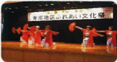
真美フレッシュ体操 (ダンス)