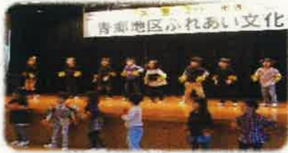
青郷保育所年中組 (合唱・体操)