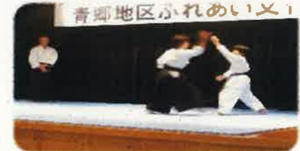
心身統一合気道会 (表武)