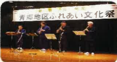
青郷バンブー倶楽部 (尺八演奏)