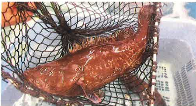
刺身で食べたい 新鮮なマハタ