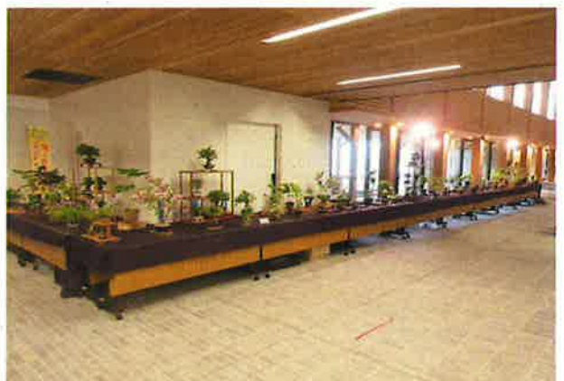
『高浜さつき同好会』 春の山野草と小品盆栽展

高浜公民館 “陽だまり” TEL : 72-7725 FAX : 72-2879