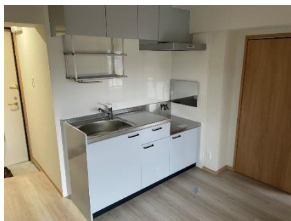
ダイニングキッチン