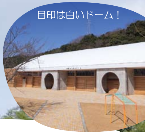
目印は白いドーム!